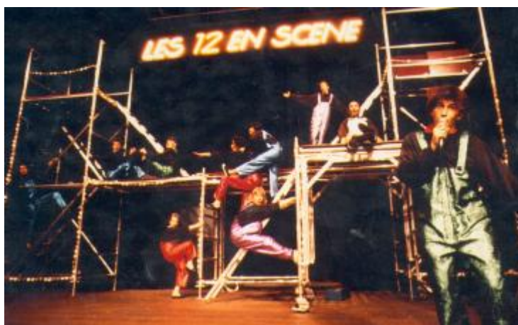
Tableau Music-hall.. On danse, on chante..

A la fin du tableau, Pierrot s'écroule dans le fly-case.. Tous arrêtent et de danser et de chanter (la musique s'interrompt).. Un rayon lumineux vient frapper le fly-case dans lequel gît le corps sans vie de Pierrot..